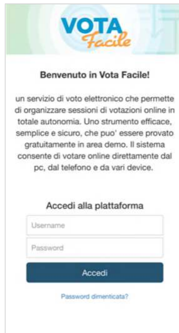
Fig. 2 - Accesso