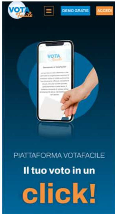
Fig. 1 - Piattaforma