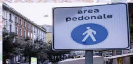
aumentare le aree pedonali