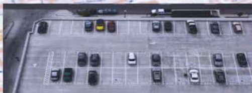
realizzare più parcheggi