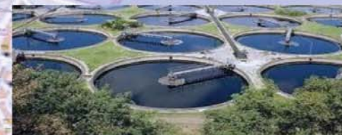
aumentare gli impianti di depurazione delle acque