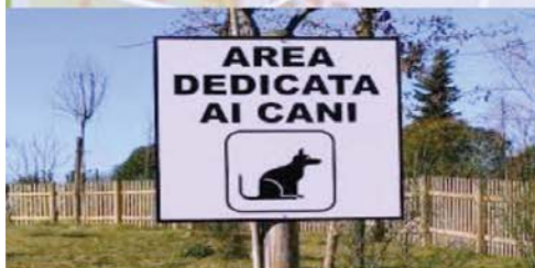
realizzare più aree dedicate ai cani