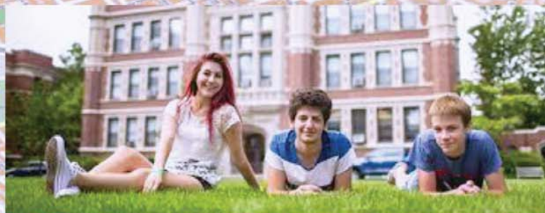
realizzare dei Campus dove insegnare l' arte e la musica ai ragazzi