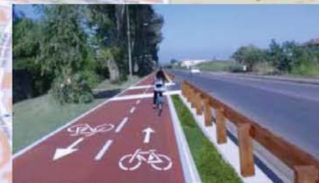
realizzare più piste ciclabili