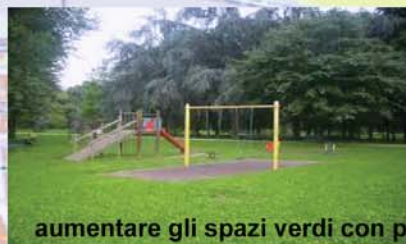
aumentare gli spazi verdi con più aree gioco per bambini